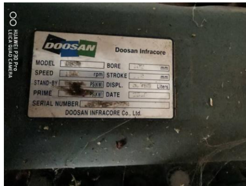
Rajah 13 - 15 : Ganset No. 2