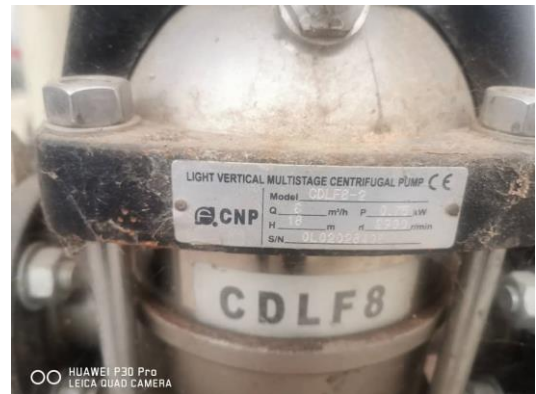
Rajah 16 – 19 : Sistem siraman dan pam air