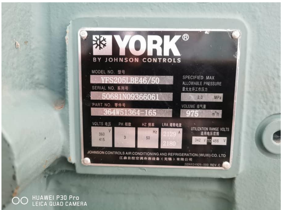
Rajah 1-4 : Chiller No. 2