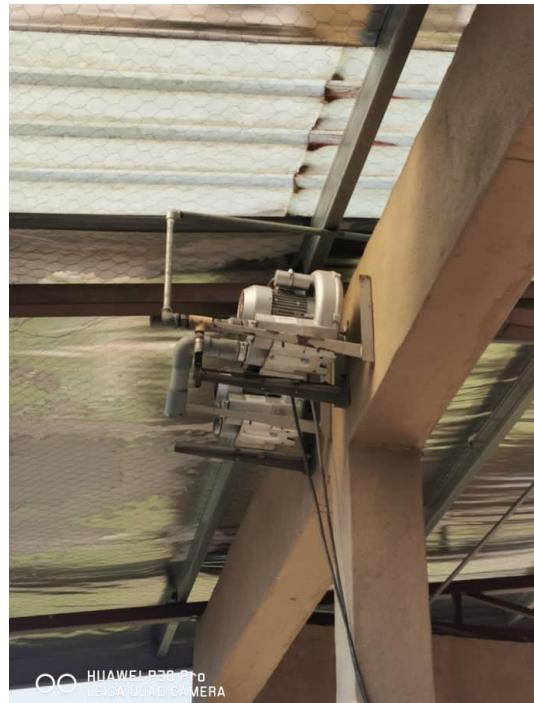
Rajah 5 – 7 : Blower di Bangunan FPH 2